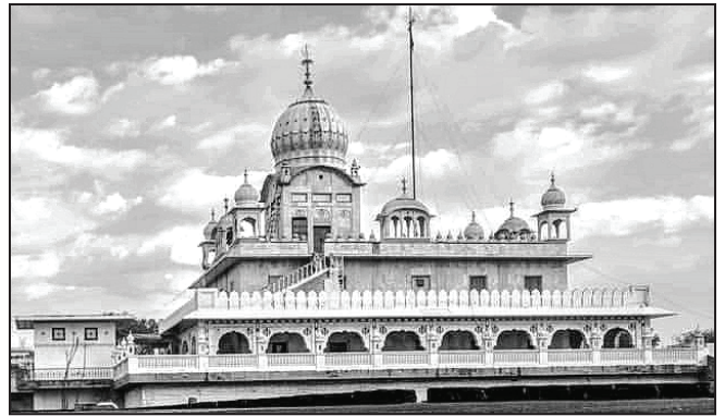
ਗੁਰਦੁਆਰਾ ਥੜਾ ਸਾਹਿਬ, ਸਮਾਣਾ (ਜ਼ਿਲ੍ਹਾ ਪਟਿਆਲਾ)

ਸਮਾਣਾ- ਸਮਾਣਾ ਬਹੁਤ ਪੁਰਾਣਾ ਸ਼ਹਿਰ ਹੈ। ਕਹਿੰਦੇ ਹਨ ਕਿ ਮੁਸਲਮਾਨਾਂ ਦੇ ਆਉਣ ਤੋਂ ਵੀ ਪਹਿਲਾਂ ਇਹ ਸ਼ਹਿਰ ਆਬਾਦ ਸੀ। ਮੁਸਲਮਾਨਾਂ ਦੇ ਆਉਣ ਤੋਂ ਪਹਿਲਾਂ ਇਸ ਦਾ ਨਾਮ ਨਿਰੰਜਨ ਖੇੜਾ ਸੀ ਅਤੇ ਫਿਰ ਇਸ ਦਾ ਨਾਂ ਬਦਲ