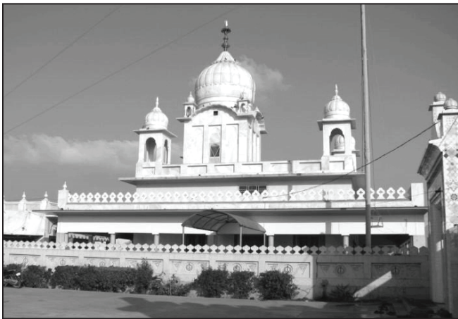
ਗੁਰਦੁਆਰਾ ਸ੍ਰੀ ਗੜੀ ਨਜ਼ੀਰ, ਸਮਾਣਾ