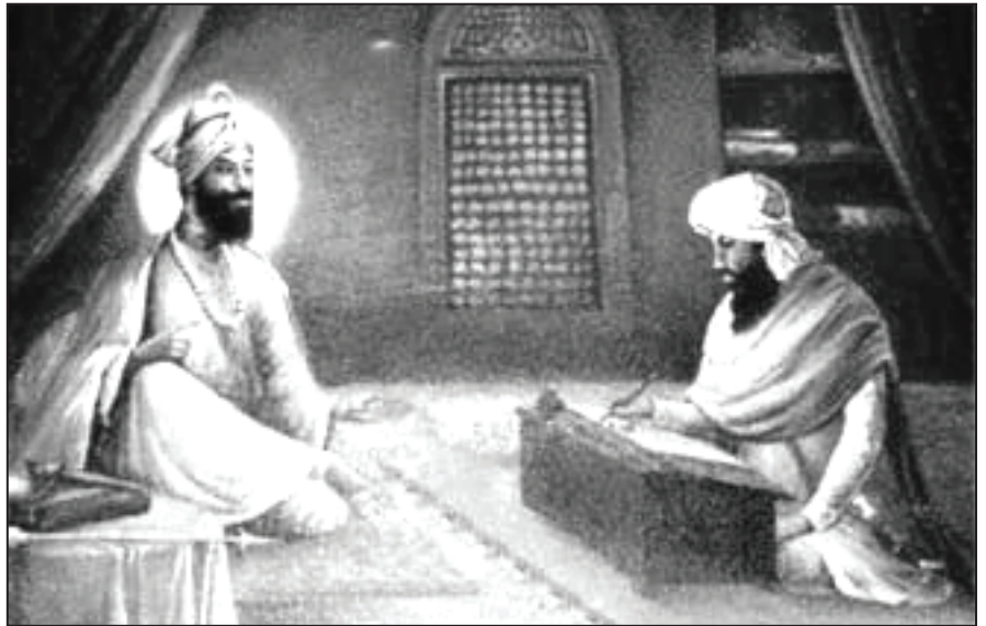
Guru Gobind Singh dictating Bani of (Guru) Granth Sahib to Bhai Mani Singh at Damdama Sahib which is popularly known as Damdami Beerh .

B hai Mani Singh, (scholar and martyr) was, according to his contemporary Kesar Singh Chhibbar, from a Kamboj family, and according to some later chroniclers, following Giani Gian Singh, Panth Prakash , from Dullat Jatt family of Kamboval village (now extinct), near Sunam (30°-7’N, 75°-48’E), in Sangrur district of the Punjab. Mani Singh is said to have been brought in the early years of his birth to the presence of Guru Tegh Bahadur at Anandpur. He