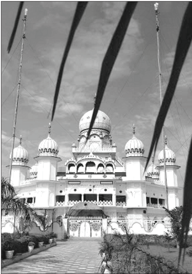
ਗੁਰਦੁਆਰਾ ਸ੍ਰੀ ਪਾਤਸ਼ਾਹੀ ਪਹਿਲੀ, ਛੇਵੀਂ ਤੇ ਨੌਂਵੀਂ, ਕਮਾਲਪੁਰ (ਜ਼ਿਲ੍ਹਾ ਪਟਿਆਲਾ)