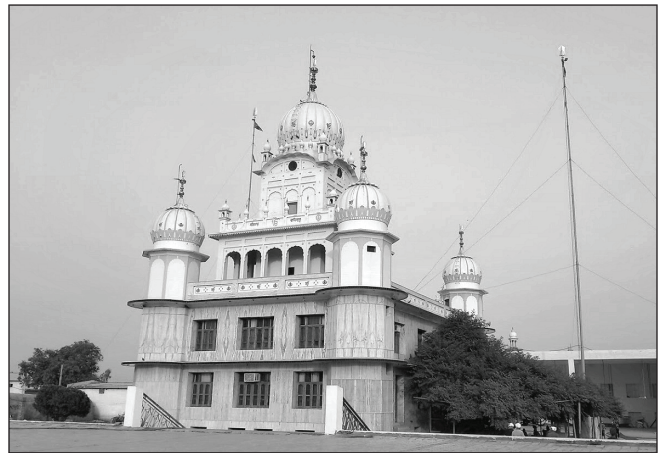
ਗੁਰਦੁਆਰਾ ਪਾਤਸ਼ਾਹੀ ਛੇਵੀਂ ਅਤੇ ਨੌਵੀਂ, ਟਲ ਘਨੌੜ ਜੱਟਾਂ